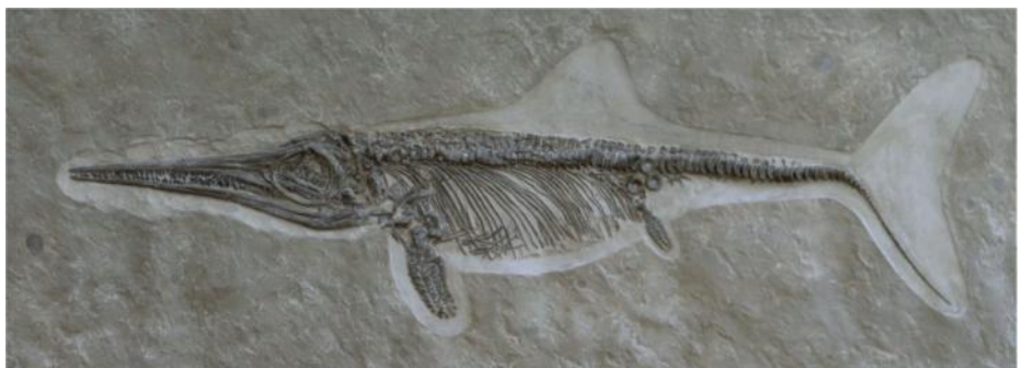
Replikat von einem Ichthyosaurus - Amaltheus - Haubourdin - Frankreich