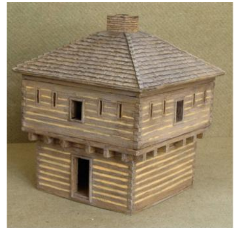
Kleinmodell von einem Haus - Marc Toillié - Seebach - Frankreich

Weitere Informationen zur Gebrauchsanweisung : www.acrystal.com > Produkte > Handbuch