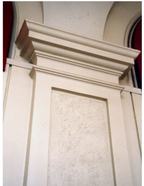
Detail einer Stützenverkleidung auf einer Fassade aus Acrystal Prima - Laminiert mit 200-4D Faser in ca. 7mm Stärke

Weitere Informationen zur Gebrauchsanweisung : www.acrystal.com > Produkte