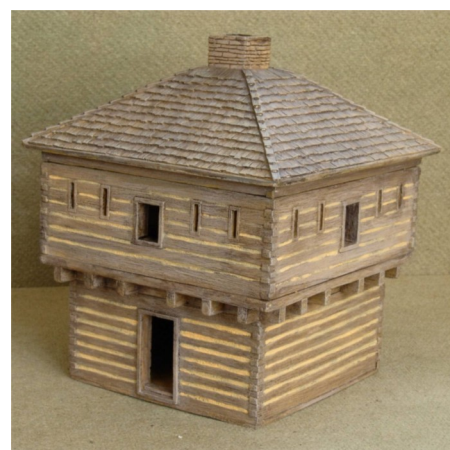
Maquette de maison - Marc Toillié - Seebach - France

Pour plus de détails concernant le mode d'emploi : www.acrystal.com > produits > manuel d'utilisation