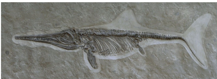
Moulage d'Ichthyosaurus - Amaltheus - Haubourdin - France