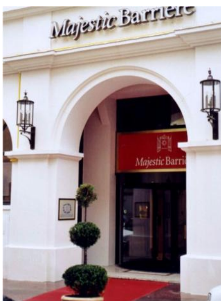
Façade de l'Hôtel Majestic Barrière à Cannes - Etudes & Réalisations Staff - Valbonne